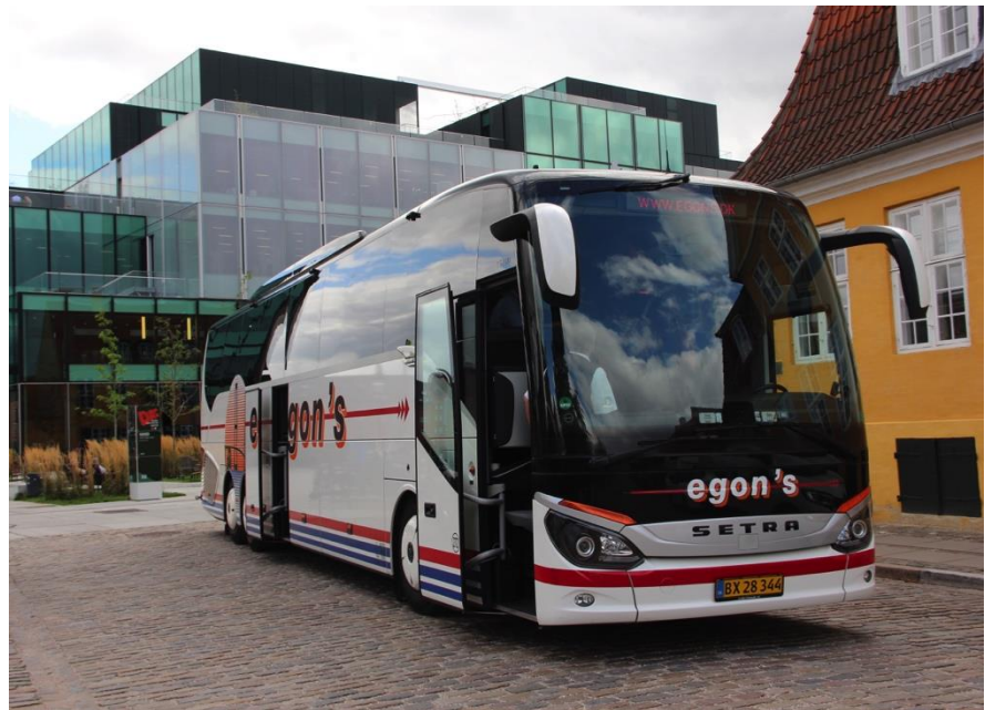
Afgang med bus fra Bryghuspladsen.