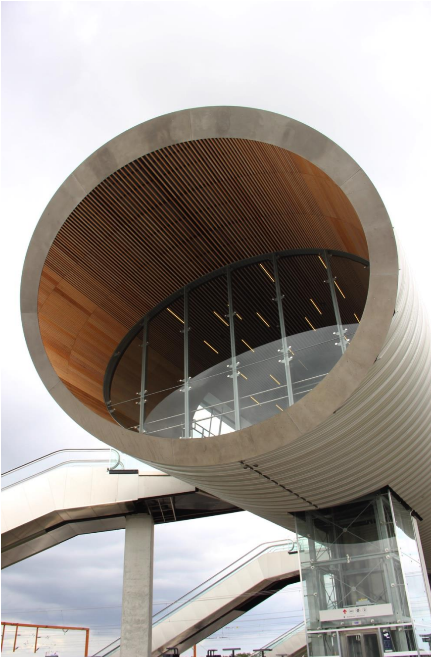
Første stop var Køge Nord Station.